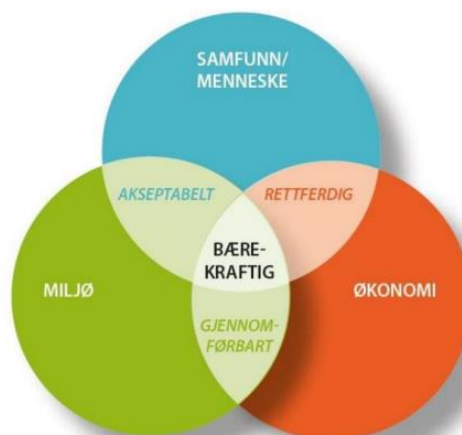
Figur - viser sammenhengen mellom de tre likeverdige bærekraftdimensjonene.

Hovedgrepene i revideringen av arealplanen har i stor grad søkelys på de klimamessige bærekraftsmålene, som å stoppe klimaendringene og å styrke naturmangfoldet. Vi skal i arbeidet ha stor bevissthet rundt å balansere de økologiske bærekraftsmålene med de sosiale og økonomiske bærekraftsmålene. Disse dimensjonene er ofte delvis i konflikt med hverandre, og det å balansere disse mest mulig vil gi det mest bærekraftige resultatet.